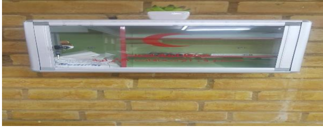
6.5- صندوق الإسعافات الأولية